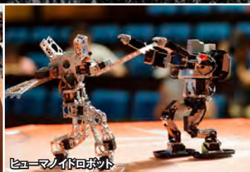
ヒューマノイドロボット