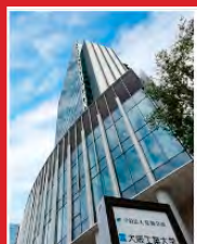
大阪工業大学 梅田キャンパス